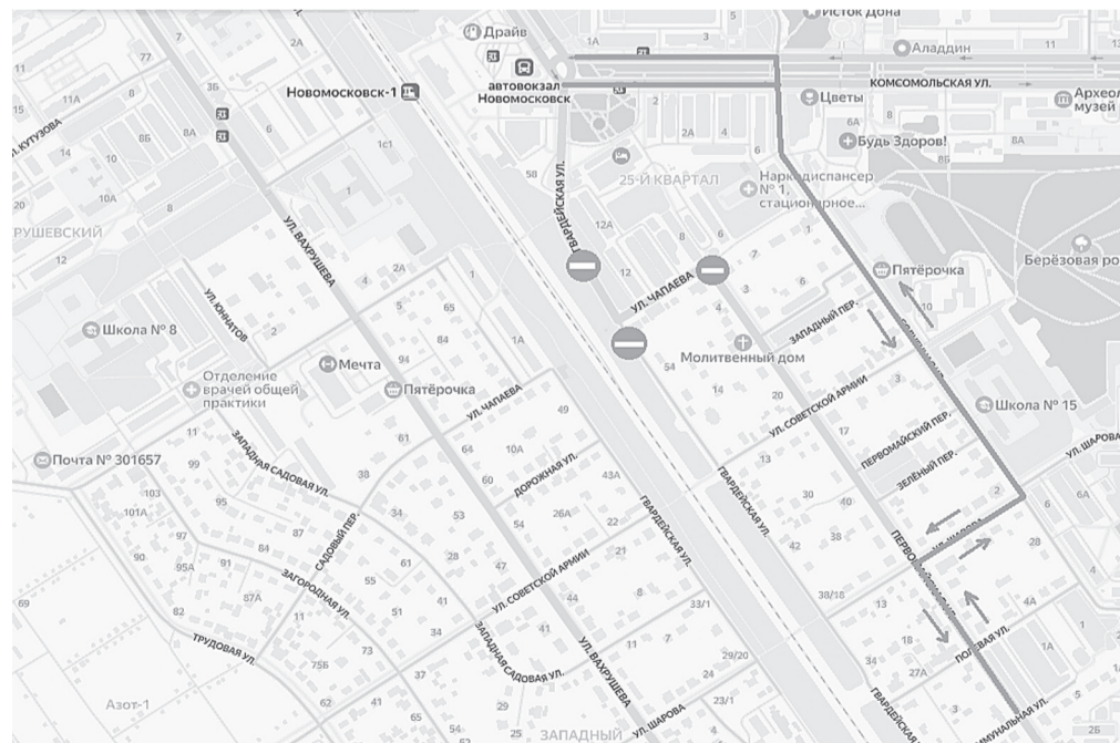
Схема временного объезда транспортных средств по автомобильным дорогам местного значения муниципального образования город Новомосковск при проведении работ по замене опор уличного освещения