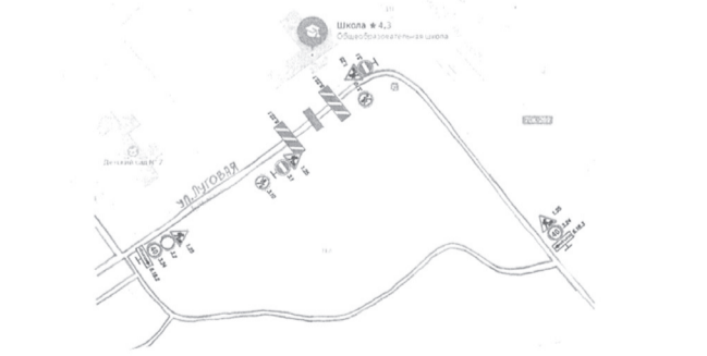
Схема временного ограничения движения и стоянки транспортных средств по автомобильным дорогам местного значения Новомосковского района Тульской области при проведении работ по прокладке тепловых сетей