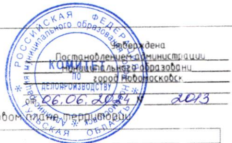
Схема расположения земельного участка на кадастровом плане территории